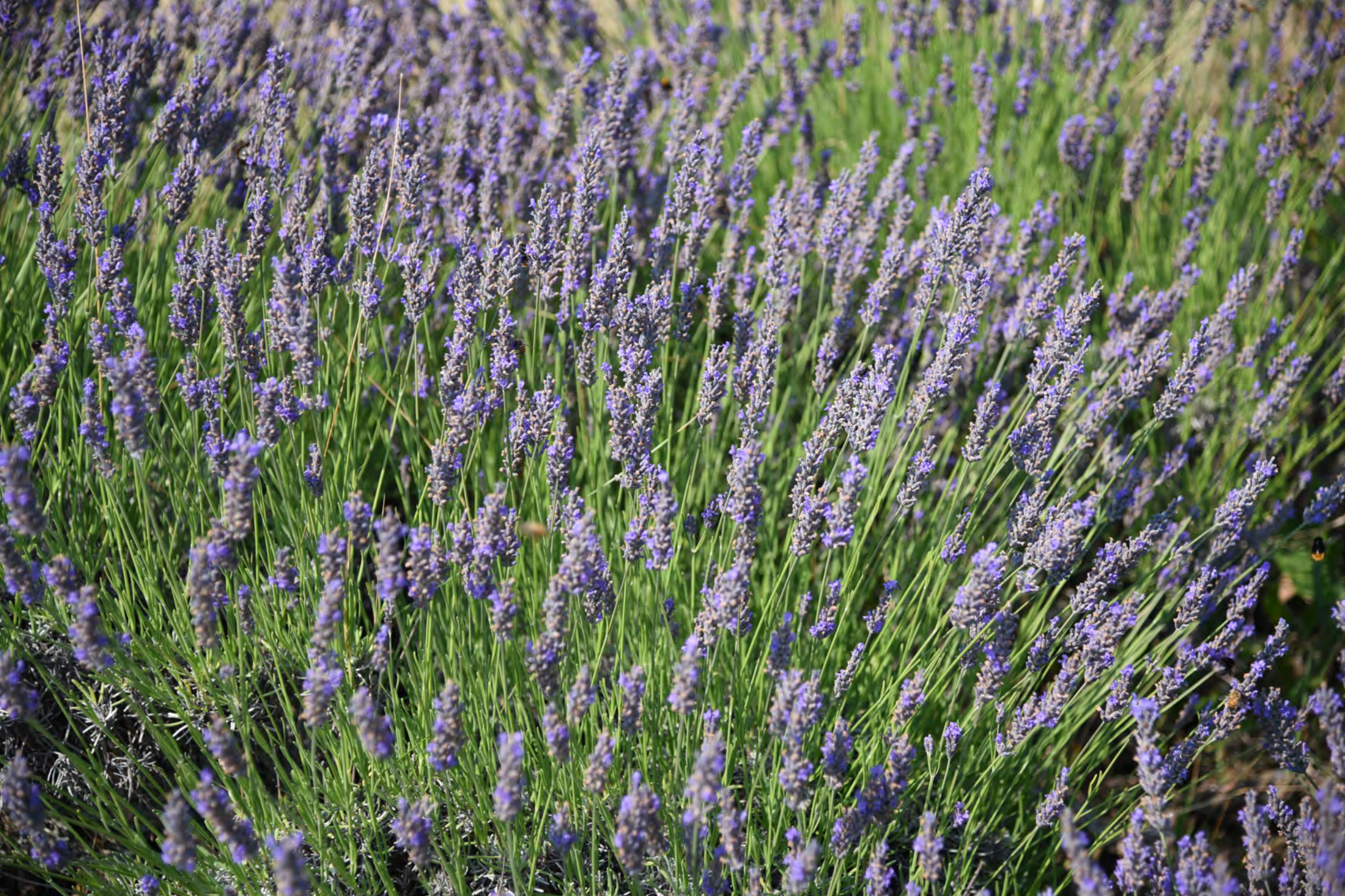
Lavanda - Istituto Agrario "L. Spallanzani" sede di Montombraro di Zocca (MO)