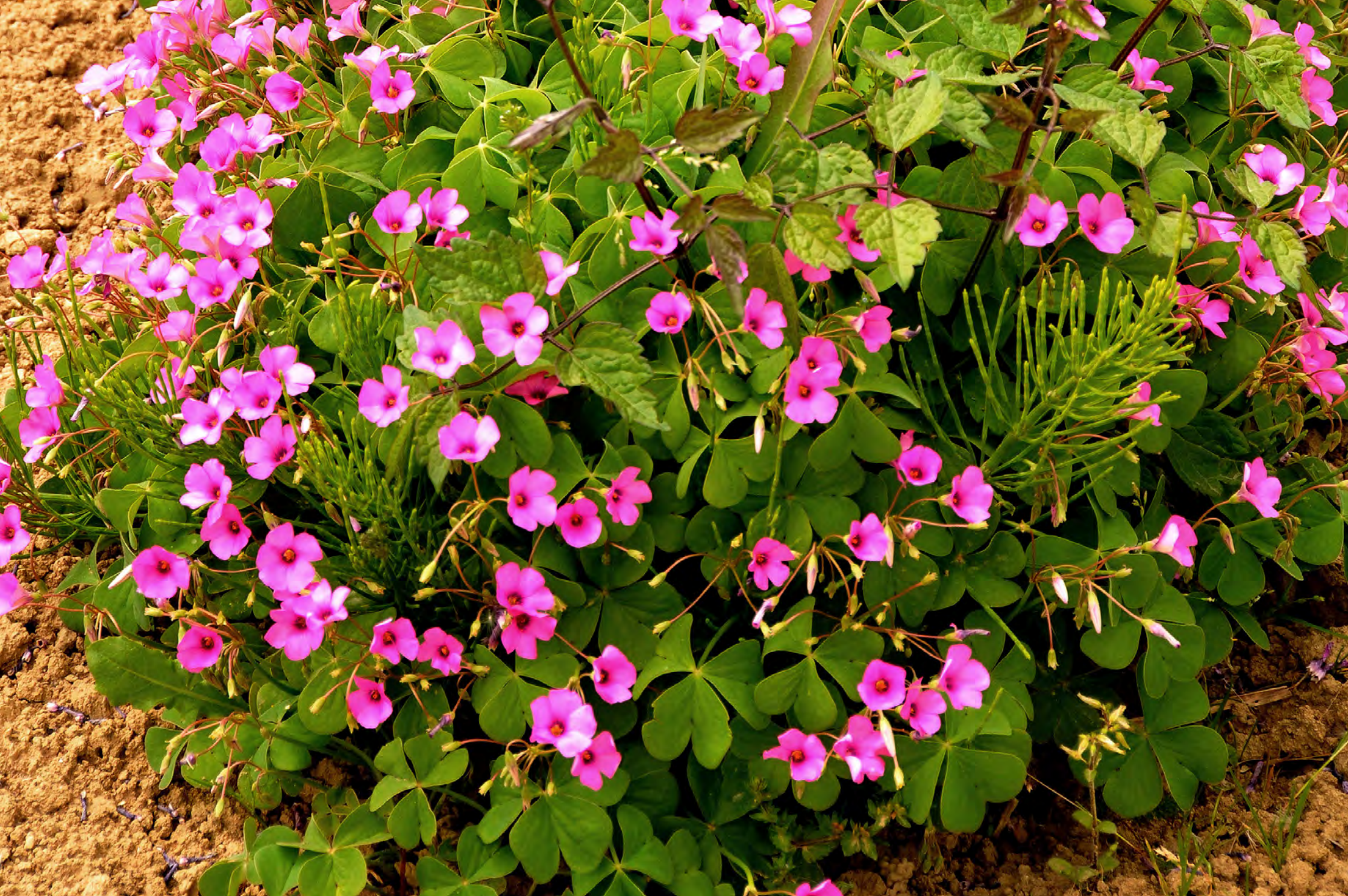
Acetosella - Il Giardino delle Erbe, Casola Valsenio (RA)