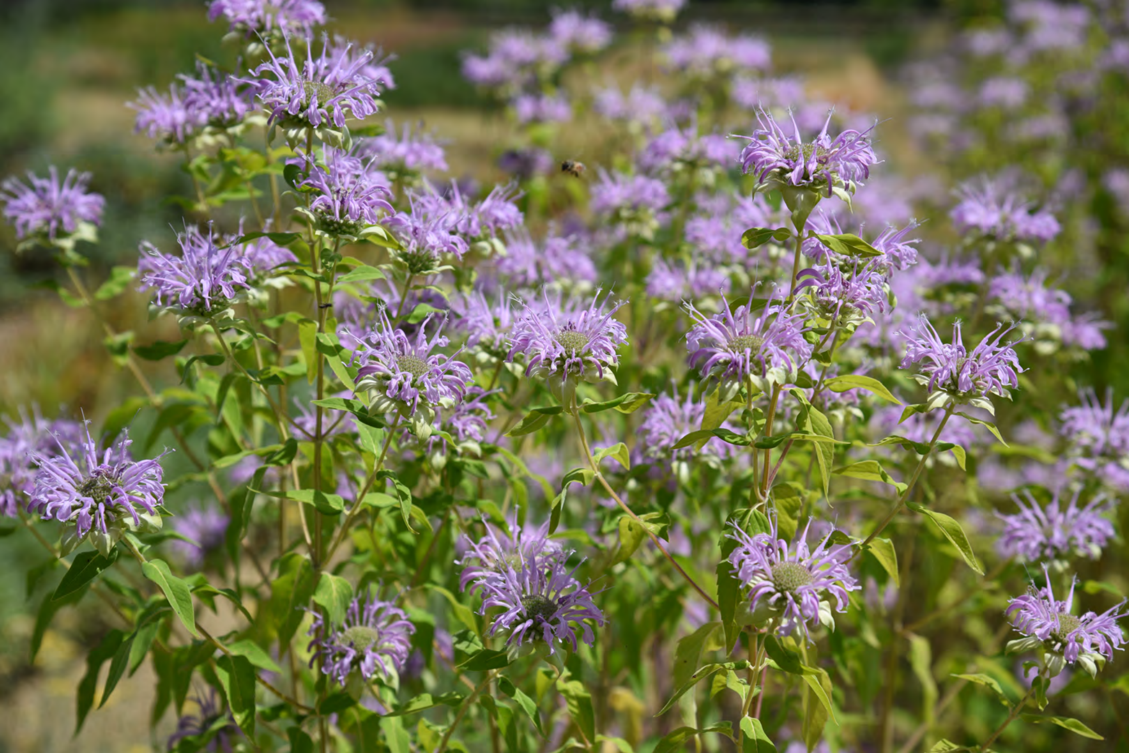
Monarda fistulosa - Il Giardino delle Erbe, Casola Valsenio (RA)