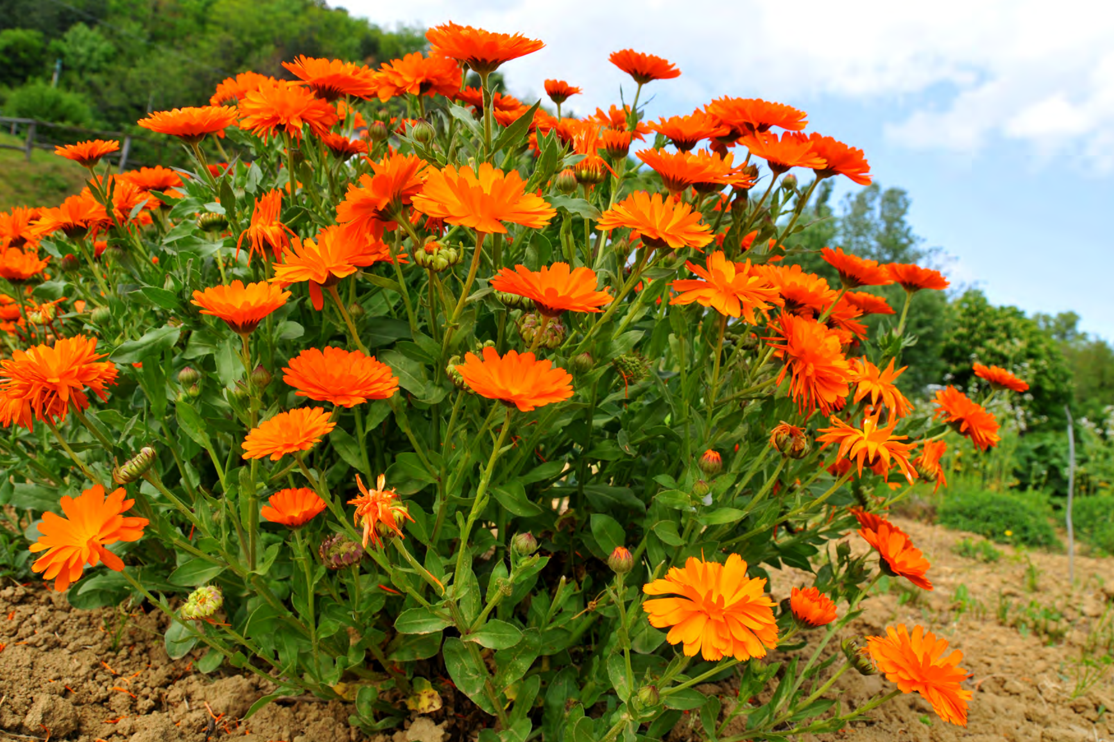
Calendula officinalis - Il Giardino delle Erbe, Casola Valsenio (RA)