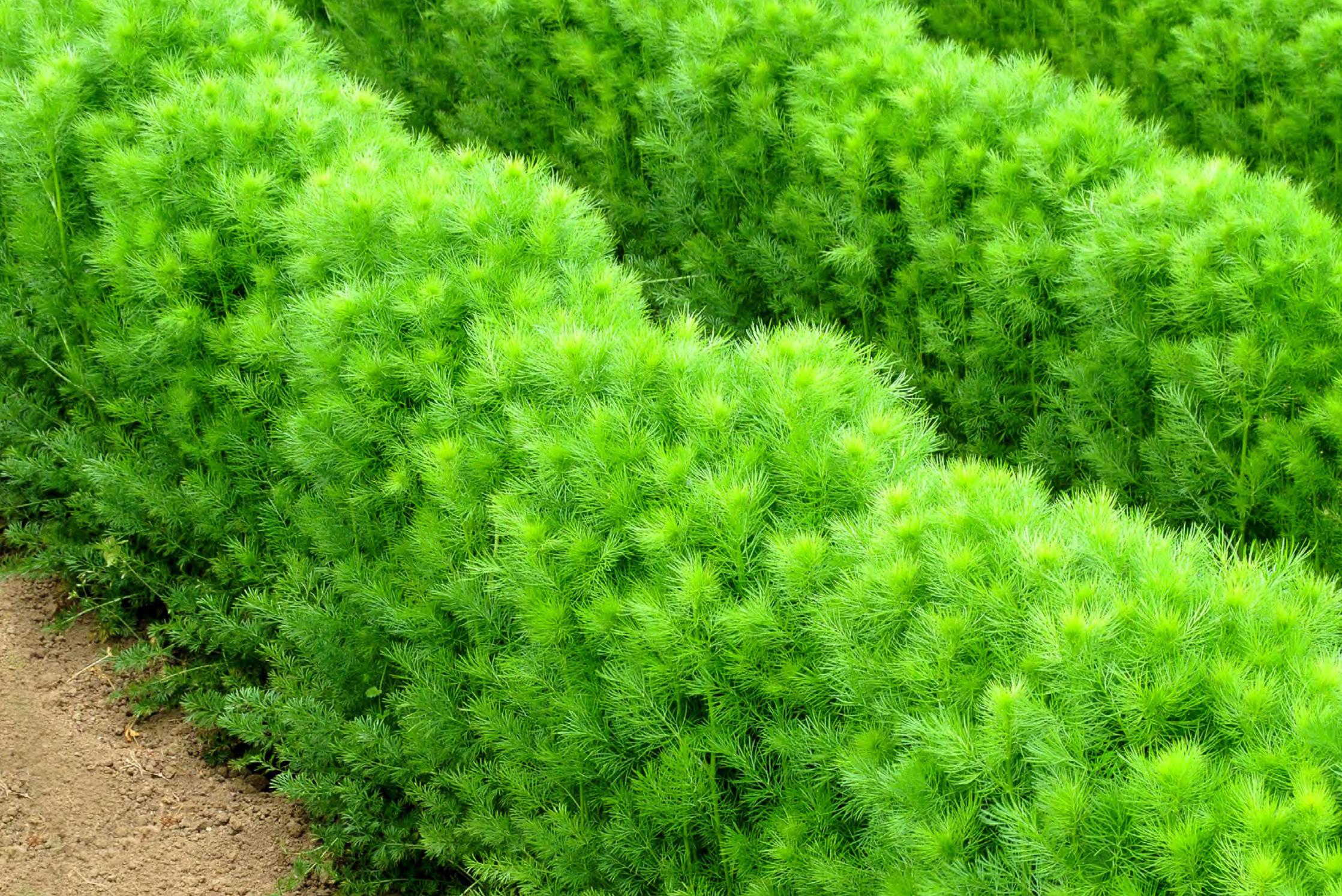
Nigella - Il Giardino delle Erbe, Casola Valsenio (RA)