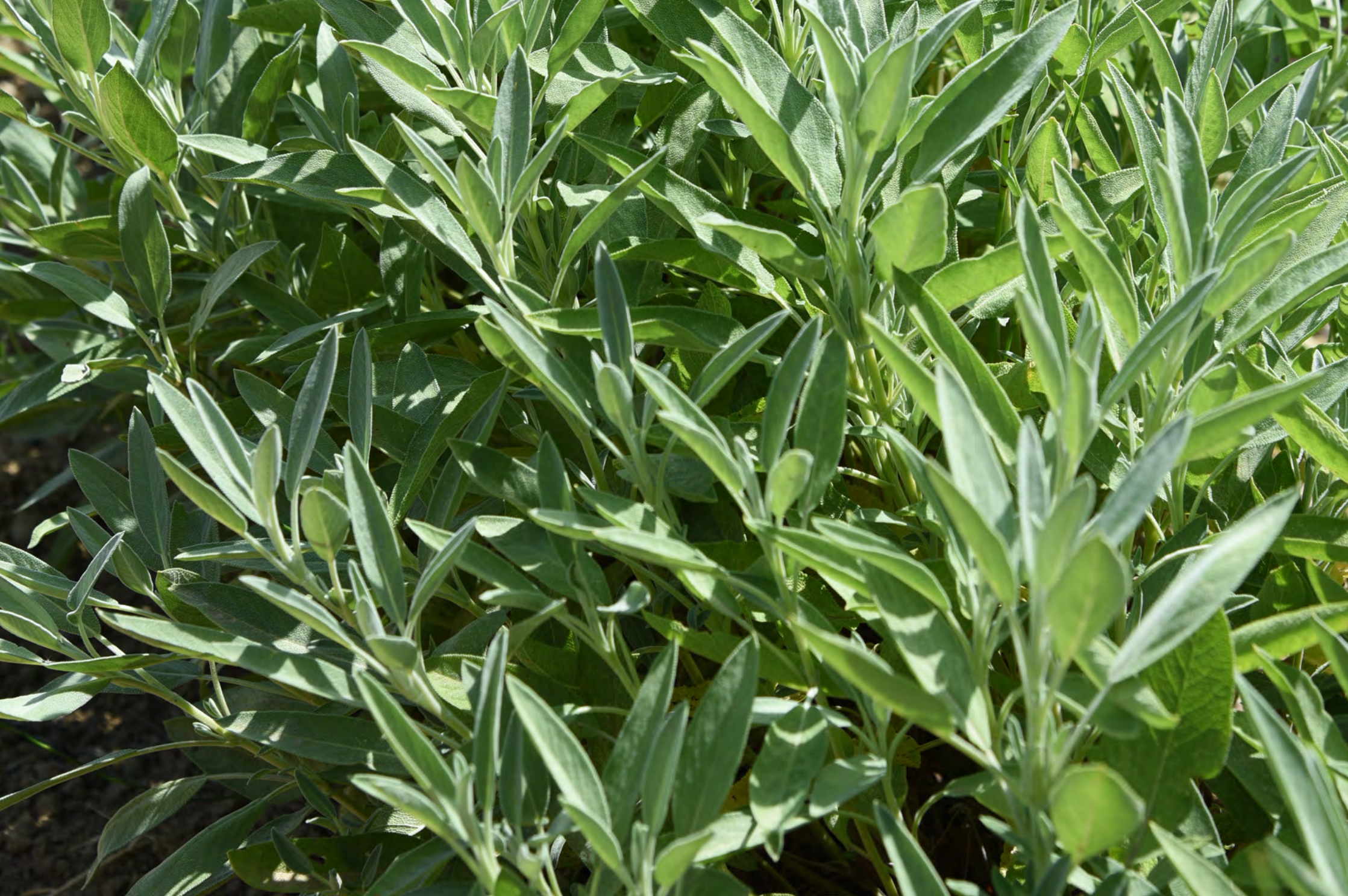
Salvia comune - Il Giardino delle Erbe, Casola Valsenio (RA)