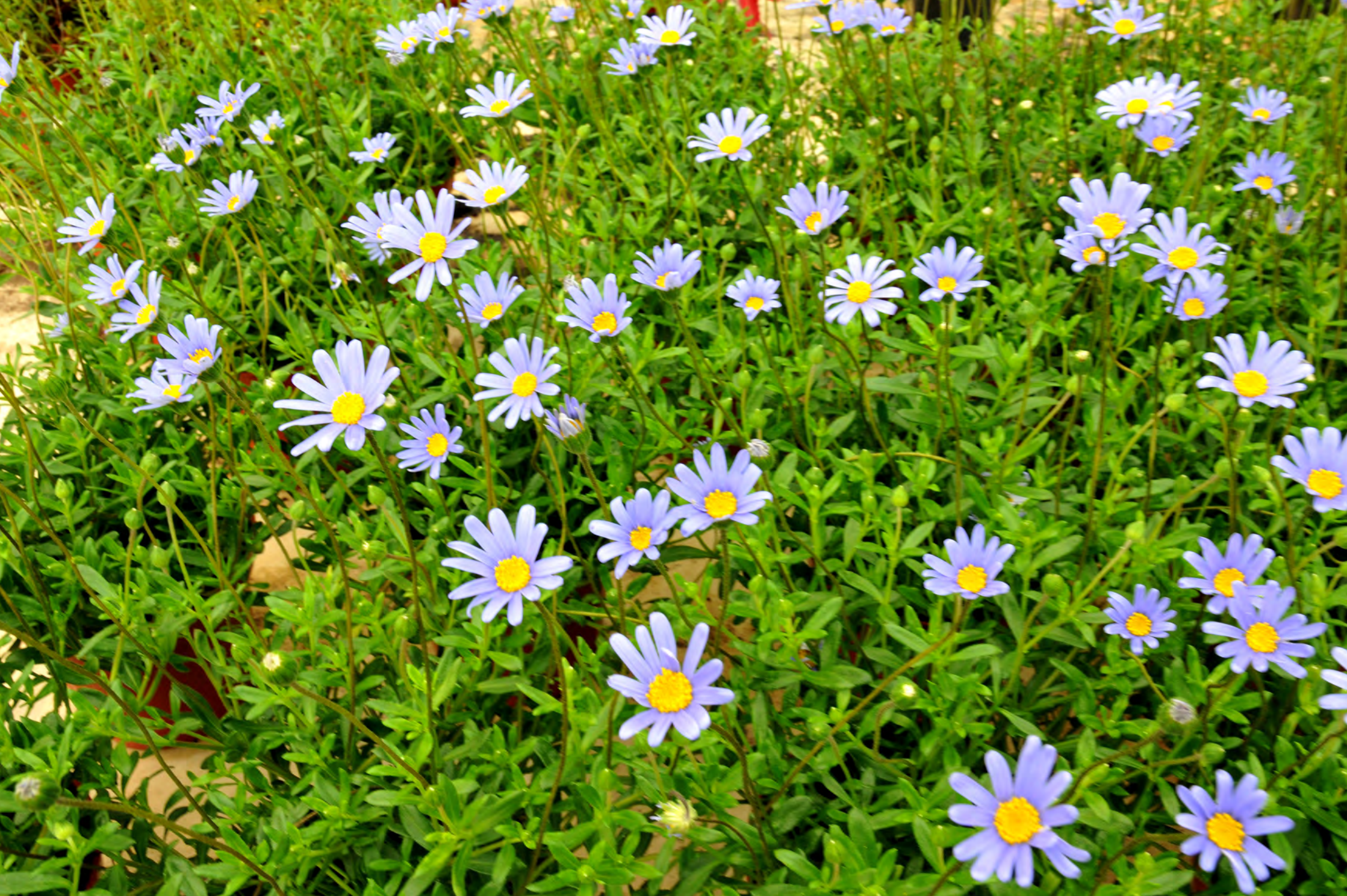
Agatheae coelestis - Il Giardino delle Erbe, Casola Valsenio (RA)