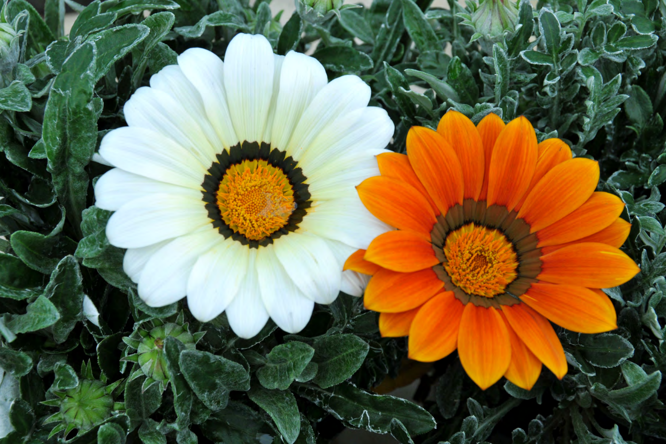
Gazania - Il Giardino delle Erbe, Casola Valsenio (RA)