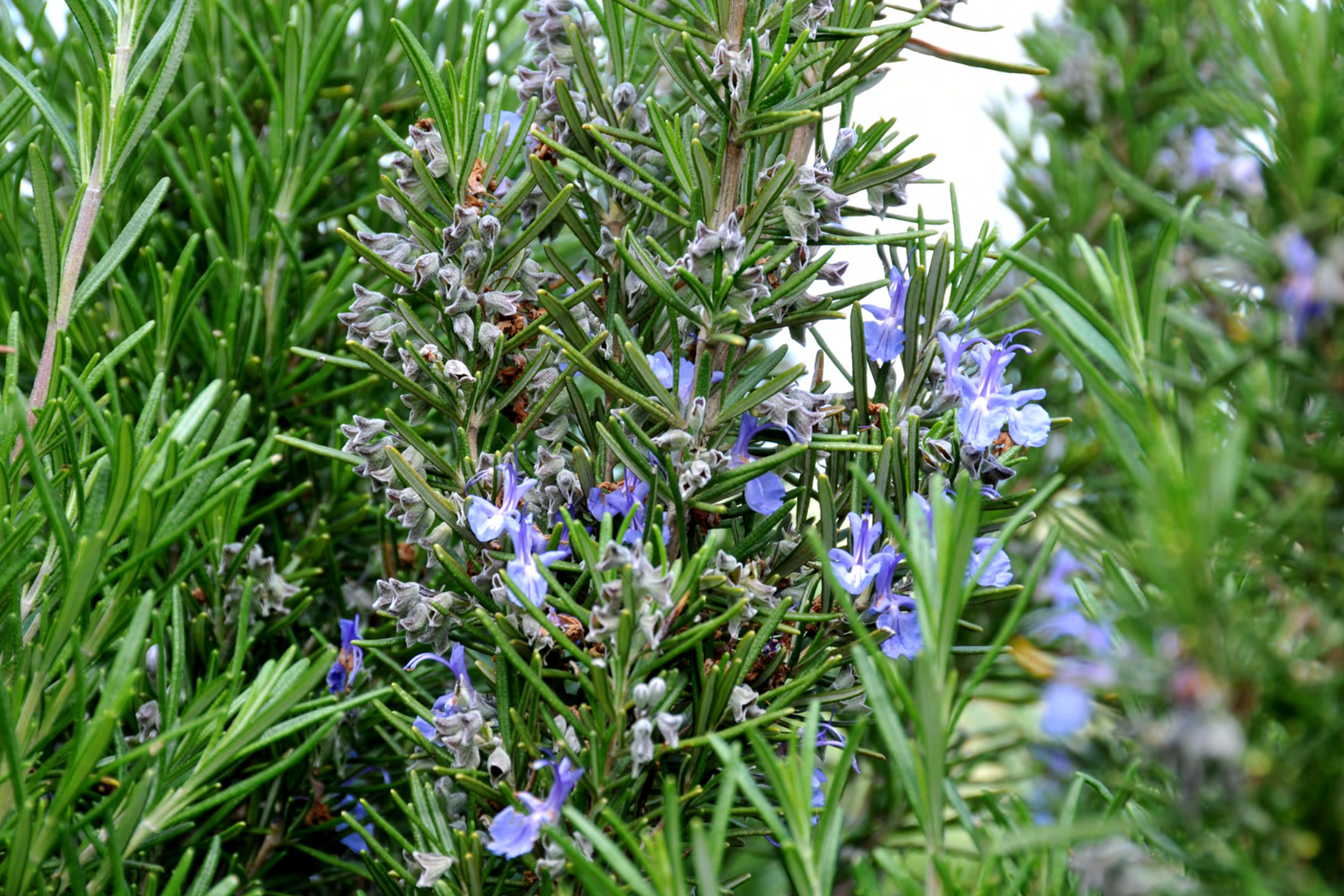
Rosmarino - Il Giardino delle Erbe, Casola Valsenio (RA)