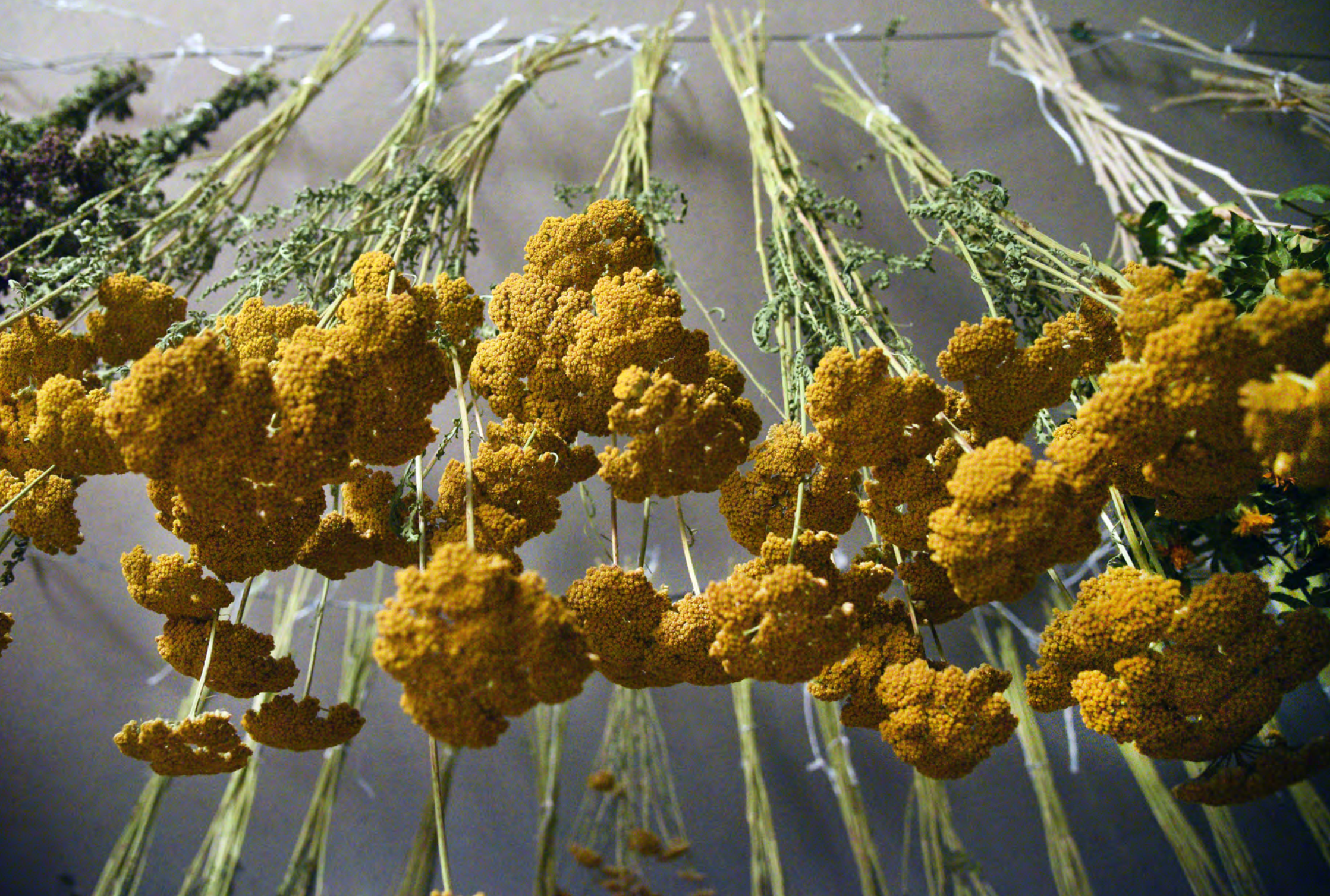
Essiccazione di fiori di Achillea filipendulina - Il Giardino delle Erbe, Casola Valsenio (RA)