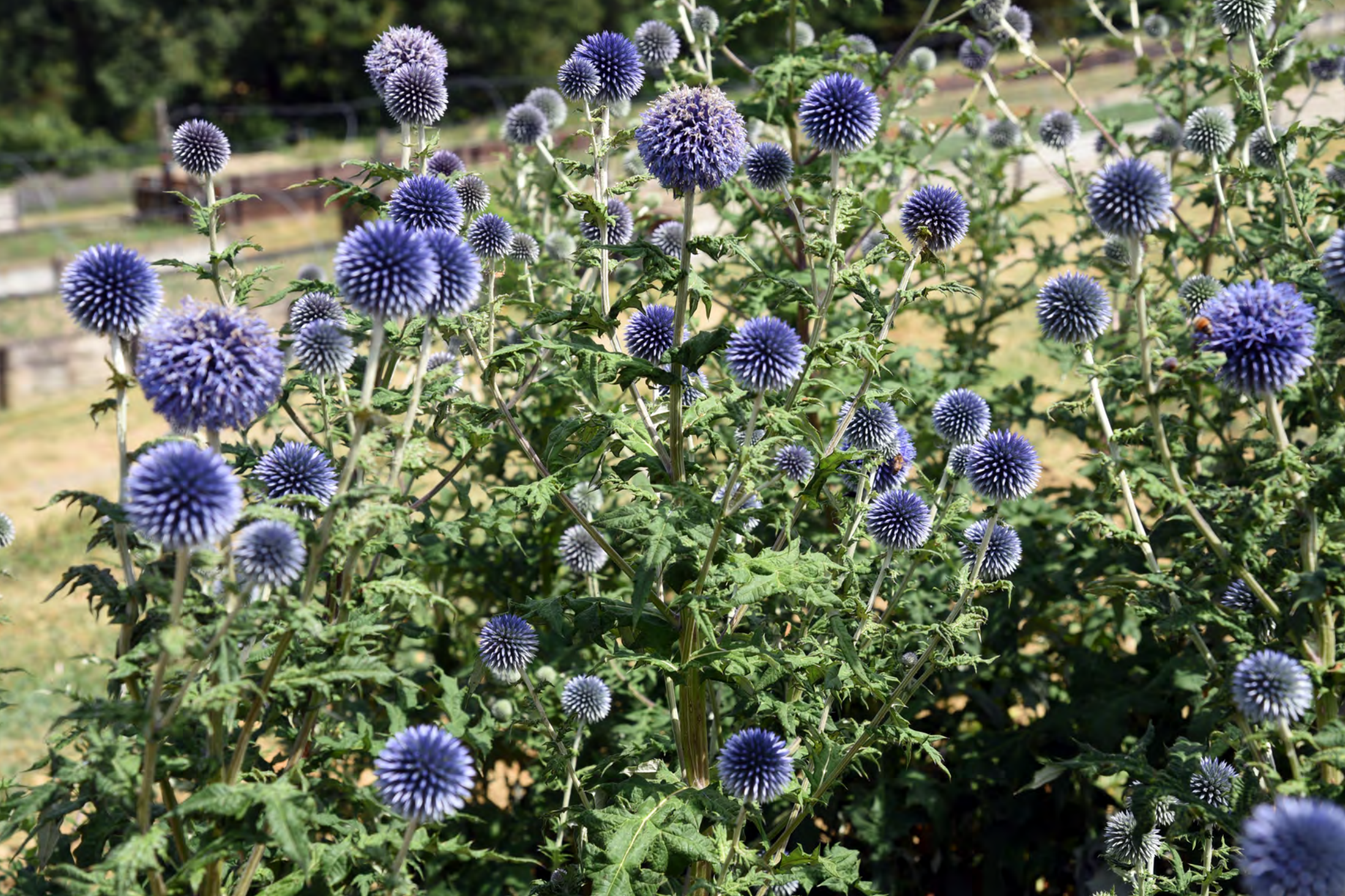
Echinops ritro o Echinopo - Il Giardino delle Erbe, Casola Valsenio (RA)